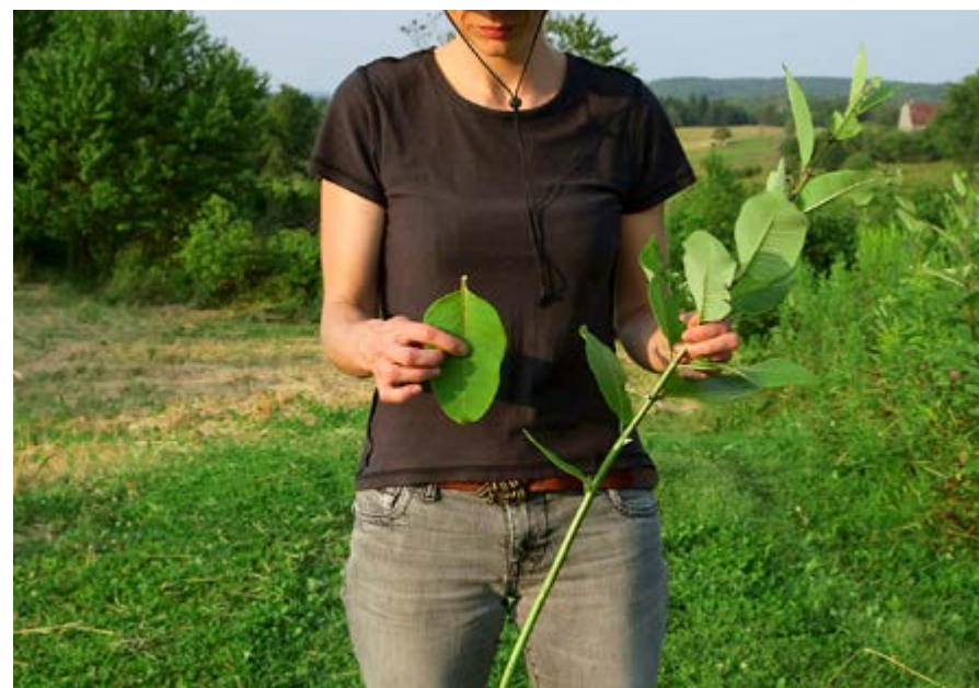
Richard Ibghy et Marilou Lemmens, Things that grow by themselves / Things that we help grow , 2014. Vidéo, 53 min. 20 s. Images tirées de la vidéo.