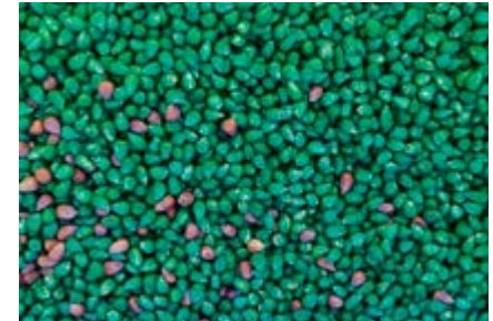
Semences de maïs traitées aux néonicotinoïdes. Image numérique.